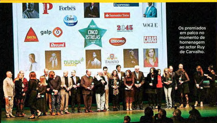
Os premiados em palco no momento de homenagem ao actor Ruy de Carvalho.